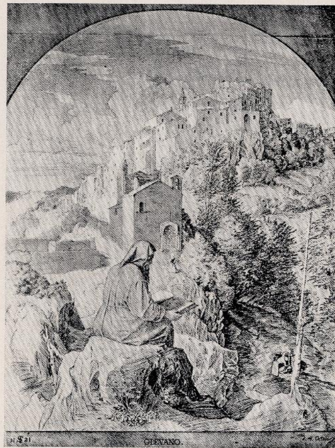
J. Schnorr - Olevano con monaco in preghiera (fac-simile di un disegno a sepia)