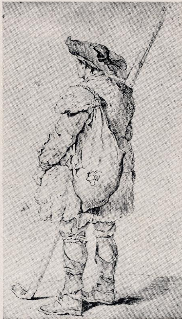
Strutt - Pastore ciociaro (disegno a lapis)