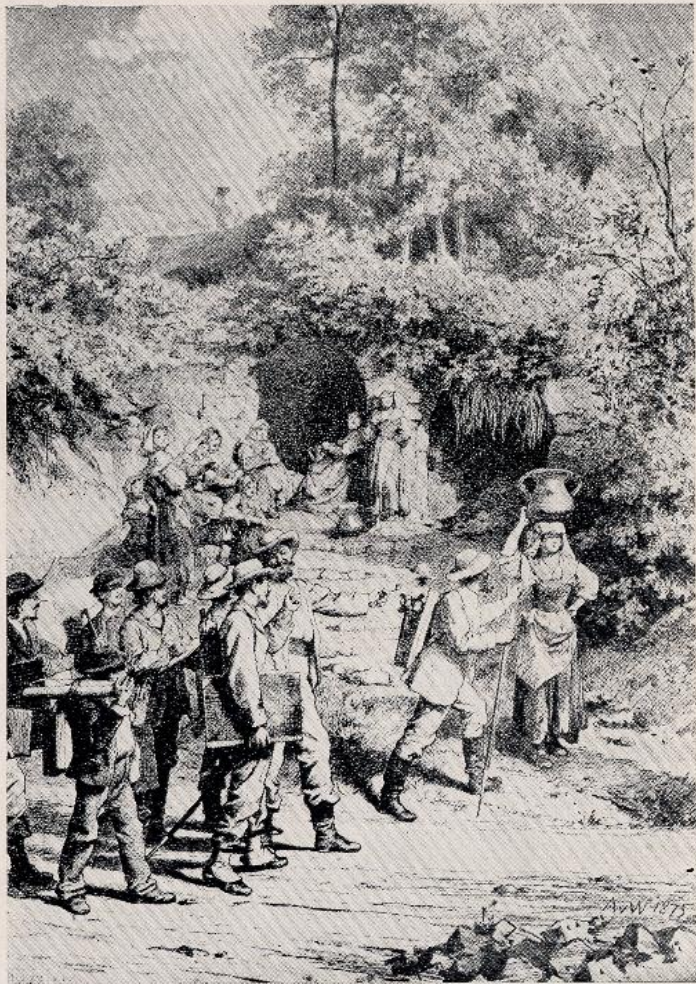
Werner - Pittori che ammirano donne in costume olevanese (incisione)