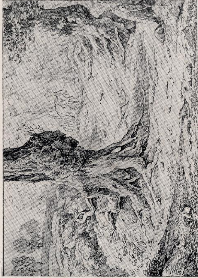
H. Voogd - Paesaggio (litografia)