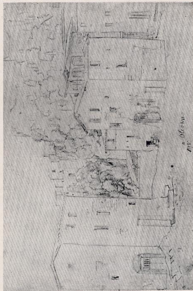
Joseph Anton Koch - Olevano (fac-simile di un disegno)