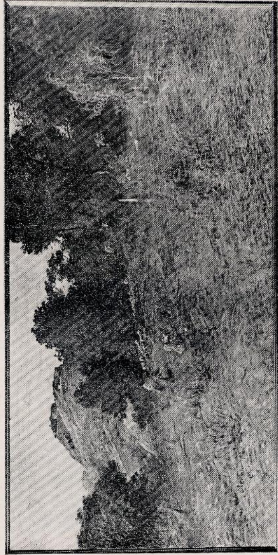
Onorato Carlandi - Olevano (tempera)