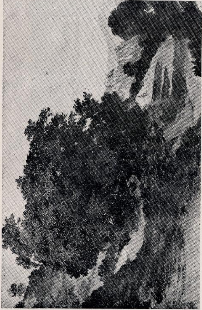
Ignoto della seconda metà dell'800 - Olevano-Serpentara con veduta di Bellegra