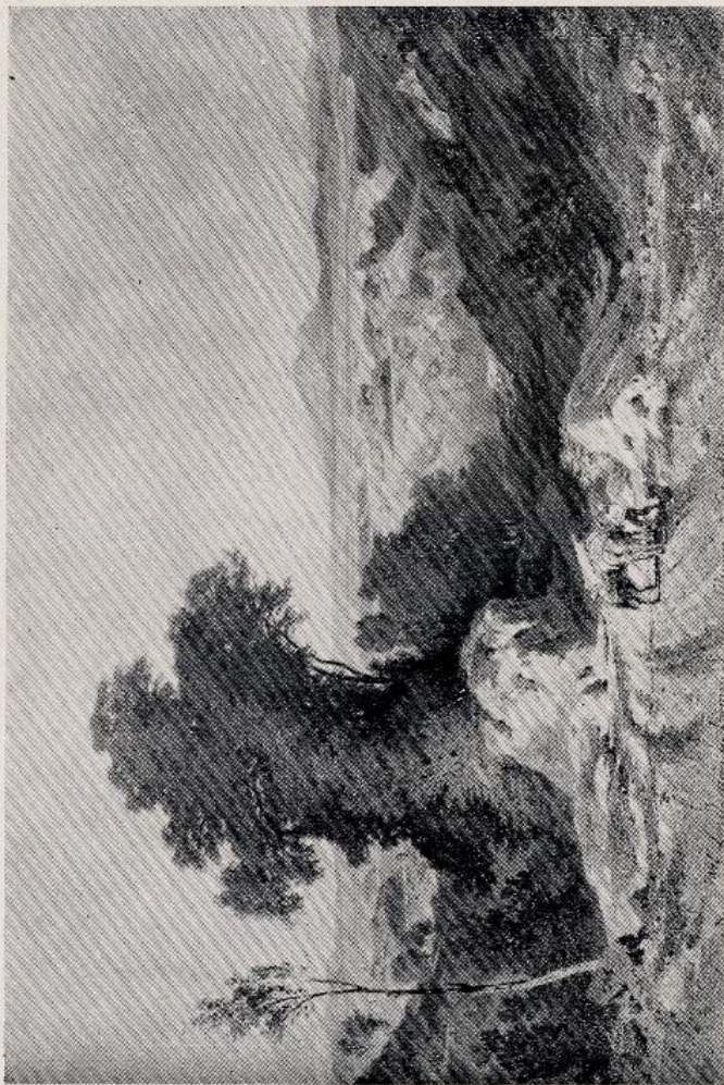
Motivo di Olevano (incisione)